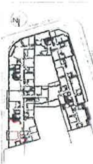
TABEAU DES SURFACES HABITABLES

100-102 AV GENERAL DE GAULLE 92250 LA GARENNE COLOMBES